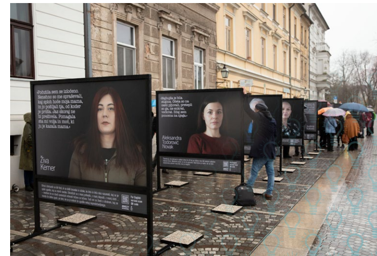
Otvoritev razstave portretov izbrisanih in njihovih otrok, Gallusovo nabrežje, Ljubljana, februar 2022.